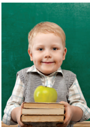
Várjuk az érdeklődőket

A Fejér Megyei Kereskedelmi és Iparkamara a VI. Iparkodjunk gyerekek vetélkedőt az NFA-KA-ITM-4/2018/TK/07 támogatási szerződés keretében valósítja meg.