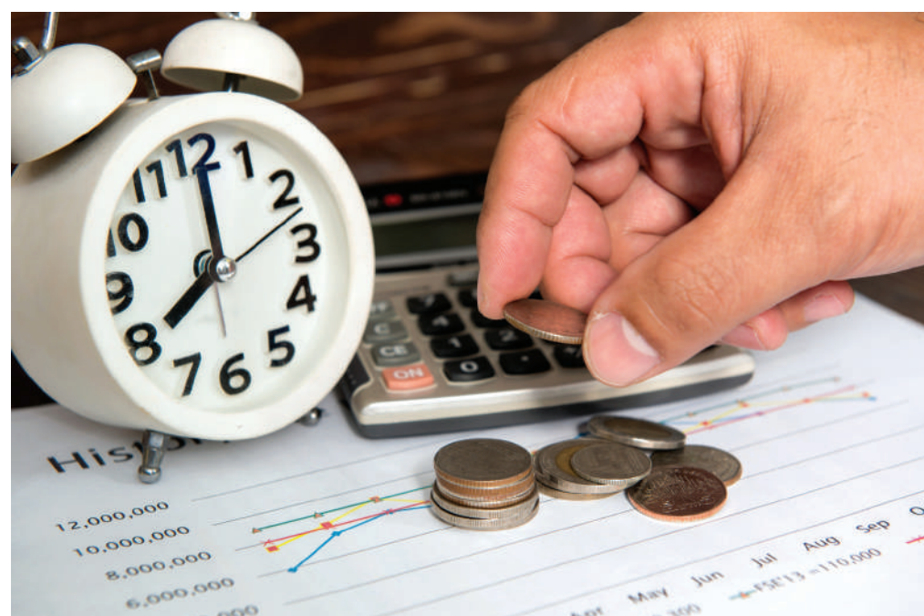
Nagyobb horderejű változások léptek életbe a 2019-es, évközi adócsomag bevezetésével

– Összességében el lehet mondani, hogy a vállalkozások működési terheit csökkentették, – amire, valljuk be nagy szükség is volt – azonban az adminisztrációs terhek megnőnek az új bevallási és nyilvántartási szabályokkal – magyarázza a könyvvizsgáló, aki szerint egyre több a részletszabály, amire figyelni kell.