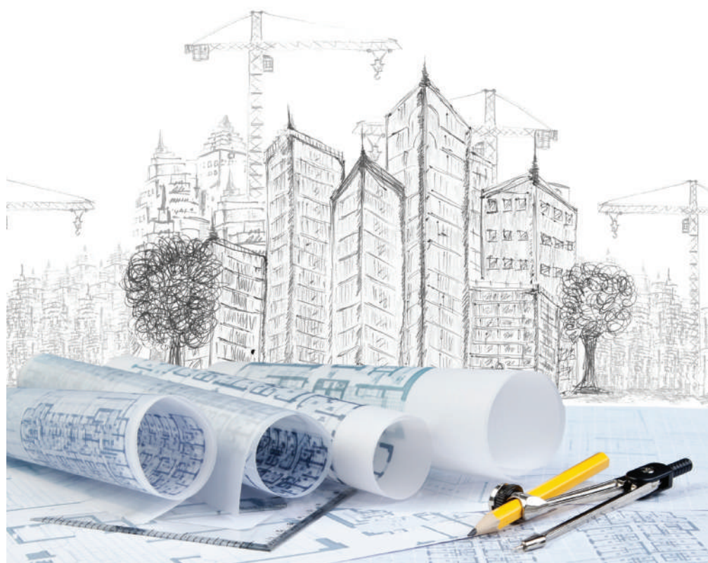
Még mindig érezhető a lakásépítési láz

– A közel nulla energiafelhasználású épületek koncepciója nem áll messze a passzív ház építés koncepciójától. A passzív ház rendszer úgy jött létre, hogy Wolfgang Feist azt vizsgálta, mennyi az az energia igény, amit fedezni tudunk légfűtéssel, vagyis