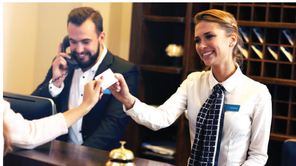
Az érintetteknek regisztrálniuk kell a Nemzeti Turisztikai Adatszolgáltató Központnál

A szálloda igazgatója szerint megoldást jelenthetne a problémára, ha tudatosítanák az állampolgároknak, hogy a GDPR nem azt jelenti, hogy az adatokat nem kell megadni, hanem azt, hogy a szálloda ezeket megvédi, nem adja ki egy harmadik fél részére.