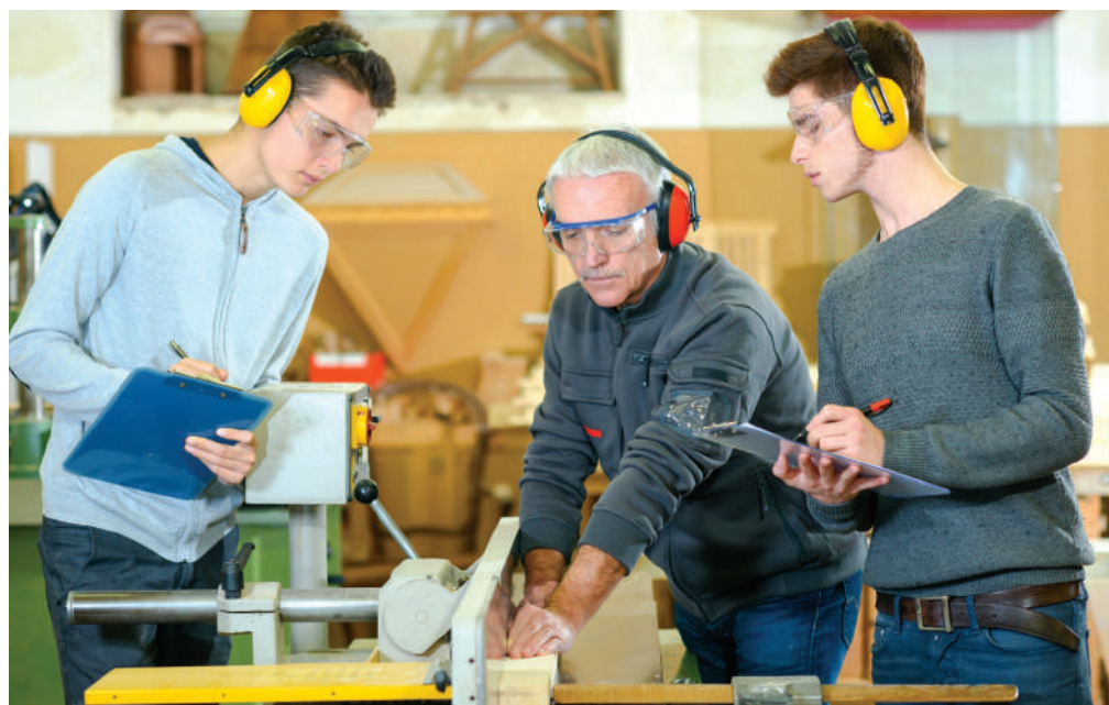
Az iskolai rendszerű képzésben 174 szakma áll a diákok rendelkezésére

Gondolkoznak az úgynevezett kreatív technikumban is, ez azoknak a gyerekeknek szólna, akik vonzódnak a művészetek felé, és ezen keresztül megismerhetnék majd a kreatív iparágat. Jelenleg a székesfehérvári szakképző centrummal dolgoznak egy ilyen képzési formán. Forrás: mti